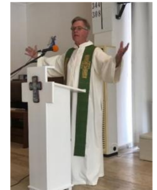
Onze nieuwe albe.

protestanten in zwang is gekomen. Het straalt ook vrolijkheid uit! Dit is een leuke foto van alle Amsterdamse dominees op de Dam, waarbij het overgrote meerderheid de albe droegen en de oudjes (..) de toga. Dit is een leuke foto van alle Amsterdamse dominees op de Dam, waarbij het overgrote meerderheid de Albe droegen en de oudjes (..) de toga.