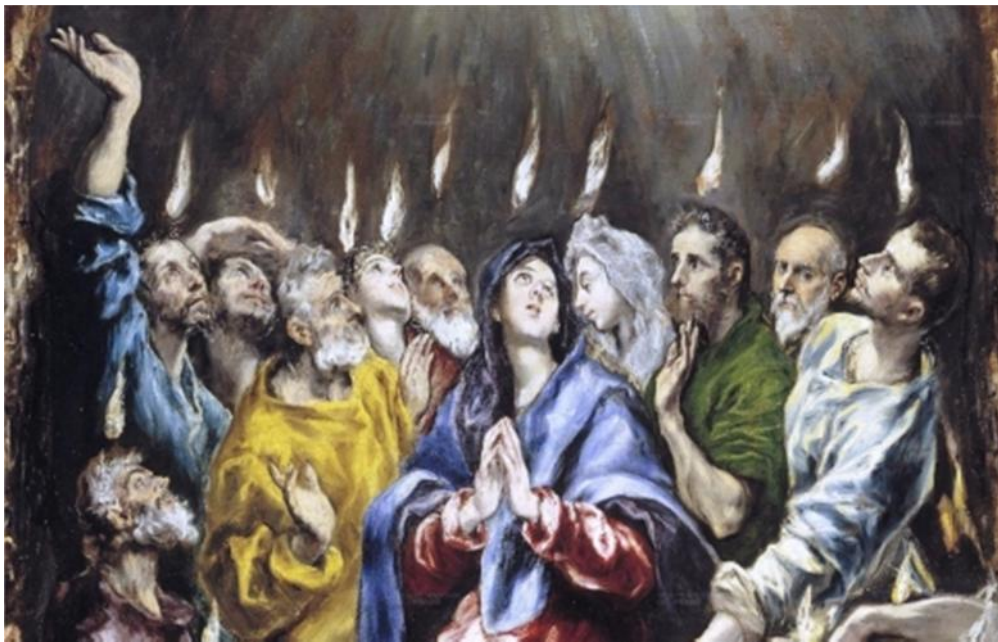
'Pinksteren' van El Greco

Troosteloos. Vanaf 2014 verdiep ik mij af en toe in de Eerste Wereldoorlog. Die woedde van 1914 tot en met 1918. De oorlog heeft grote gevolgen tot op de dag van vandaag, positief en negatief. Ik geef een paar voorbeelden. Positief: medische mogelijkheden – zoals plastische chirurgie, burgerluchtvaart, vrouwenemancipatie, opvang van vluchtelingen. Negatief: Frankrijk en Groot Brittannië verdelen in 1918 het Midden Oosten onder elkaar. De spanningen rond Syrië in 2018 hebben alles te maken met de manier waarop dat toen ging. Iets anders: nieuw is in 1914 de totale oorlogsvoering, waarbij voortaan burgers niet meer worden ontzien. Veel gelovigen raken in en na de oorlog voorgoed hun vertrouwen in de Kerk kwijt en ook in God. Hoe kan Hij nu de hand hebben in deze ongekende verschrikkingen!? Men waant zich alleen op de wereld en zonder hoop. Veel moeders weigeren –als Rachel, zich te laten troosten.